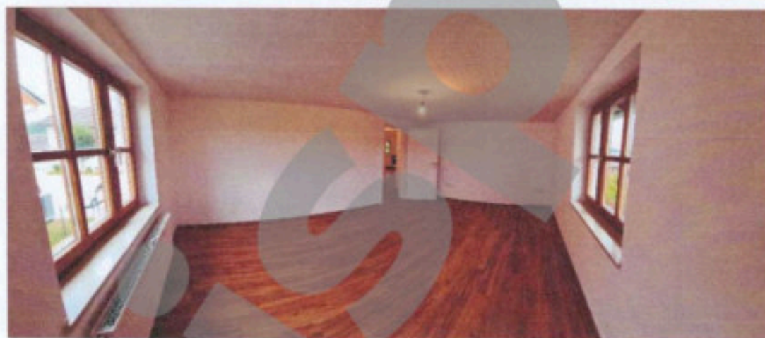
Arbeitszimmer / Gast, Mitte 10 m 2 :